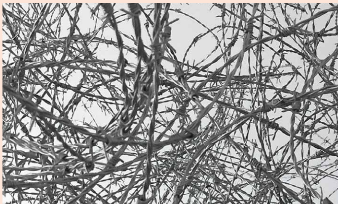
Qin Yufen, Making Paradise (Ausschnitt)