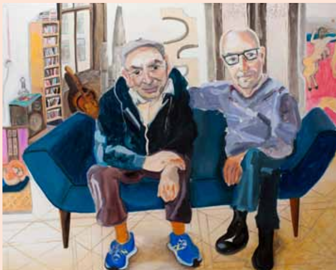
Katrin Plavčak, Marcus und Albrecht, 2017, Öl auf Baumwolle, 120 x 150 cm VG Bild-Kunst