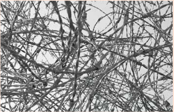
Qin Yufen, Making Paradise (Ausschnitt) , Foto: Qin Yufen